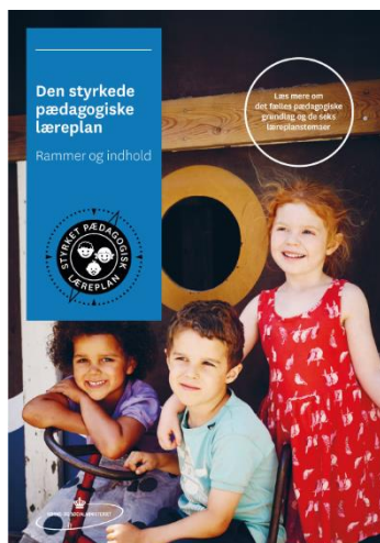
Den styrkede pædagogiske læreplan. Rammer og indhold

Personalet i Klynge B har to gange om året fælles personalemøder, hvor der arbejdes med at opbygge et fælles vidensgrundlag, samt at understøtte faglig sparring. Personalet har forskellige funktioner i de enkelte enheder i forhold til den faglige udvikling, og her arbejdes der også på tværs af Klyngen. Som eksempler kan nævnes: sprogetværk, Kbh. barn netværk og også de faglige fyrtårne.